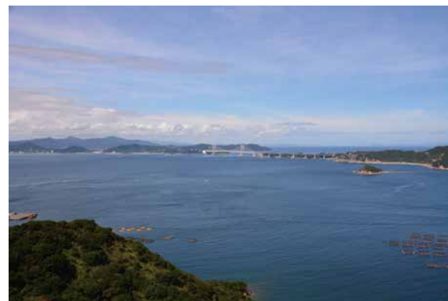
若人の広場（南あわじ市）からの眺望景観