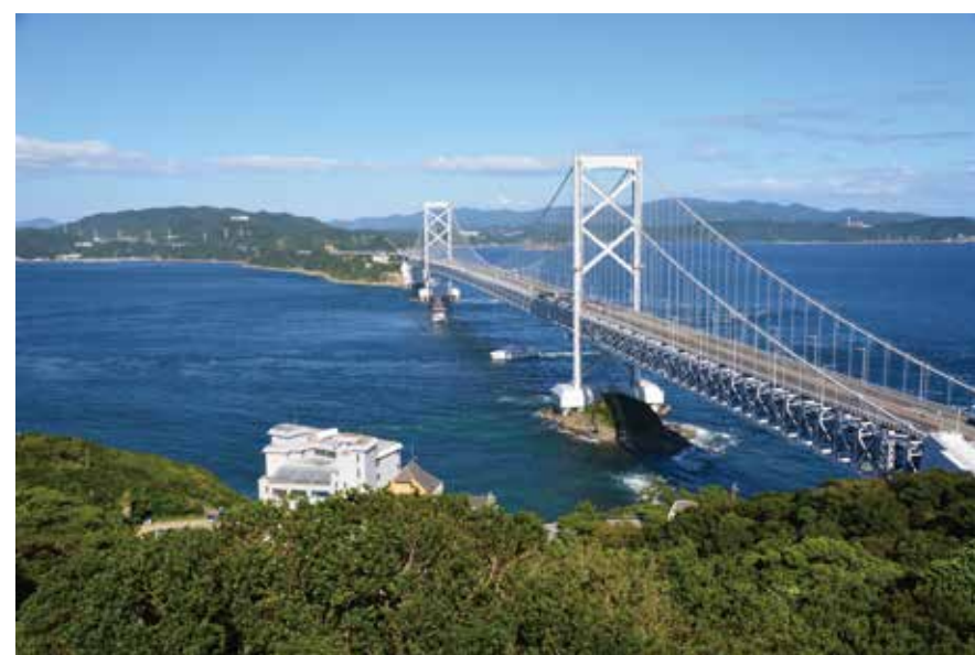
鳴門山展望台（鳴門市）からの眺望景観

鳴門海峡の眺め（眺望景観）は、日本を代表する景観として「日本八景（1927年）」に選ばれるなど古くから親しまれています。この眺望景観を保護するためには、眺望地点から遠い山並などが、どの範囲まで眺められるのかを調べる必要があります。