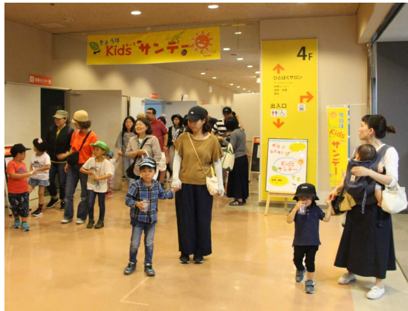
ひとはく Kids サンデーの館内のようす

どのようにしたら自然環境や生きものに、もっと興味を持ってもらえるのかについて実践的な研究を行っています。ひとはくでは様々な対象にプログラムを実施しています。特に小さな子ども（未就学児～小学3年生）とその家族向けには「ひとはく Kids サンデー」という日（月の第1日曜日）を設けています。その日には、いろいろな体験型のプログラムを用意しています。2012年度から実施していますが、小さな子ども（図1は未就学児を対象）の来館者数は年々増加しています。また第1日曜日だけでなく、他の日曜日も未就学児の来館者が増加傾向にあるのは興味深いです。