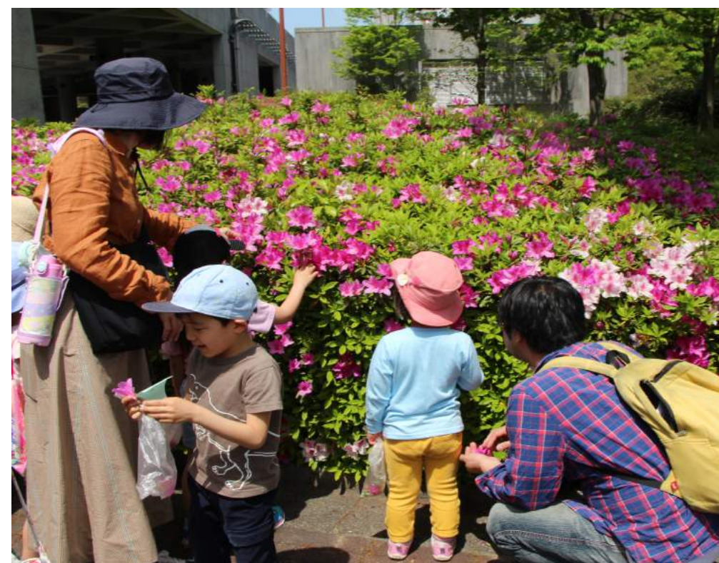
野外での体験プログラムのようす