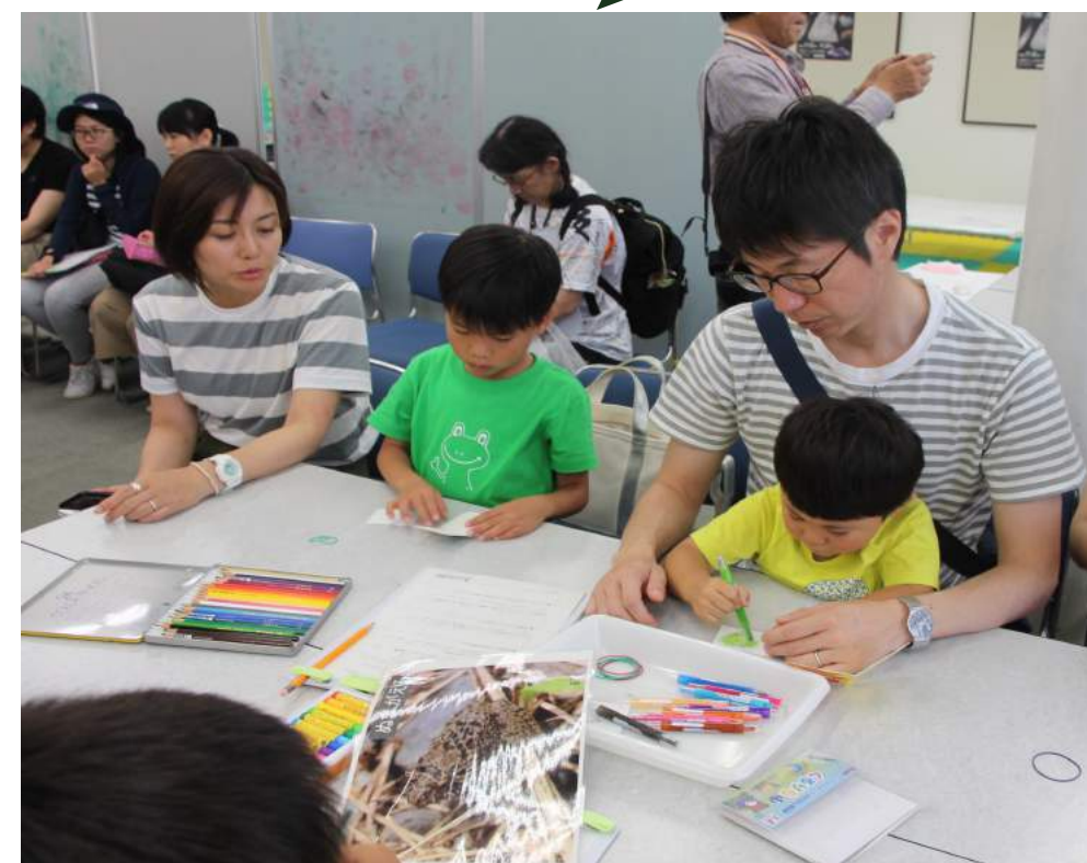
室内での体験プログラムのようす