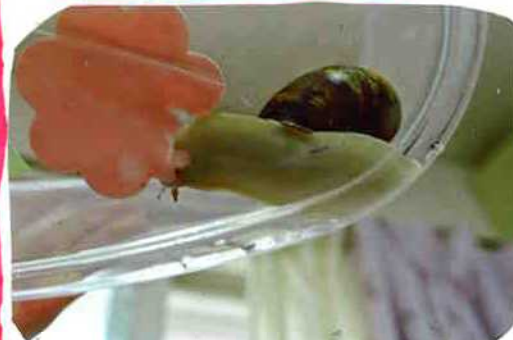
モグモグ モグモグ