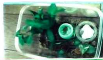
湿度の高い 飼育ケース

クビキリギスの体色は、終齢幼虫の時過 ごした環境の湿度によって決定されるそ うです。 湿度の高い飼育ケースと湿度の低い飼育 ケースを作り、幼虫を飼育してみました。