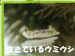
生きているウミウシ