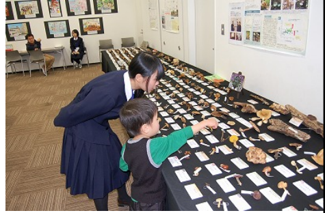
写真1 ○○○○○ (MSゴシック 9pt)

本文 (MS明朝 10pt 左揃え) ○○○○○○○○○○○ ○○○○○○○○○○○○○○○○○○○○○○○○○○○○○○ ○○○○○○○○○○○○○○○○○○○○○○○○○○○○○○ ○○○○○○○○○○○○○○○○○○○○○○○○○○○○○○ ○○○○○○○○○○○○○○○○○○○○○○○○○○○○○○ ○○○○○○○○○○○○○○○○○○○○○○○○○○○○○○ ○○○○○○○○○○○○○○○○○○○○○○○○○○○○○○