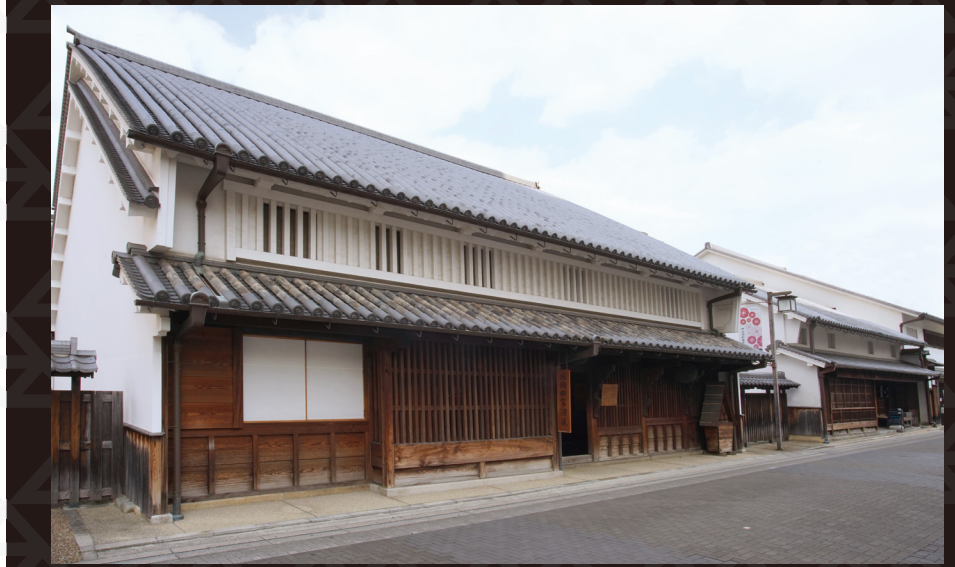
みやのまえ文化の郷は、美術館、工芸センター、伊丹郷町館（旧岡田家住宅、旧石橋家住宅、新町家をいう）に（公財）柿衛文庫を加えた文化ゾーンの愛称です。文化財の酒蔵や江戸時代の商家、日本庭園も常時公開しております。