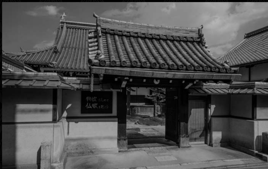
龍岸寺は浄土宗の寺院で、元和2年(1616)に、僧三哲(安井算哲/源蓮社長譽三哲和尚)により開かれました。安井算哲は、江戸幕府初代天文方となった渋川春海の父親でした。春海自身も、晩年江戸に移住するまでは龍岸寺にあった屋敷に住んでいました。