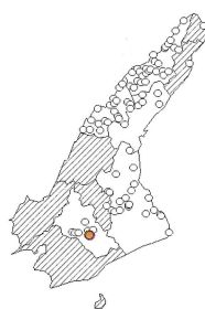
ヌートリアの分布と侵入年代 (2003年調査)