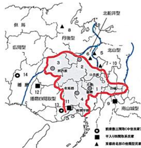
図1 摂丹型民家の分布域と周辺の民家型式

また、屋根の妻側の三角形の部分、通常は穴が開いていて、煙り抜きなどになっていますが、摂丹型民家の場合は、その部分に破風(はふ)と呼ばれる妻飾りを付加します。家屋の妻側を正面にし