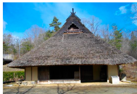
図3 標準的な摂丹型民家の正面(妻側)の破風