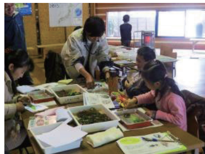
参加者の作品の一部

この講座では、海藻の美しい姿とアートとしての魅力を実感していただくことをモットーに開催しました。「海藻おしば」は、「標本」と「アート」に大別できます。参加者の方々には、ひとつの海藻をきれいに広げ、じっくり観察していただきながら、名前も調べ、標本作りを体験していただきました。そして、いろいろな海藻を使ってのアート作品にも挑戦していただきました。ただ作品を作るだけでなく、「見てさわって海藻を知ろう！」の講座同様、海藻博士だからこそ伝えることのできる、海藻の魅力についても熱く語りました。そして、素晴らしい作品がたくさんでき、参加者の方々の高いセンスに多くのことを学びました。