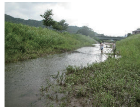
図3 C地点(舟瀬橋下流)