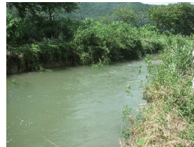
図1 A地点(舟瀬橋上流)

5名で投網(図5)およびタモ網で30分間、魚類を採集し、採集した魚類の種類と個体数を記録した。この調査を各地点で3回ずつ行い、その合計を結果とした。