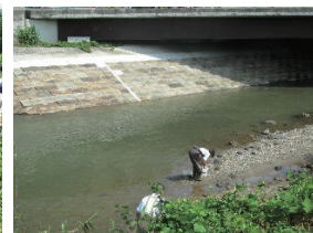
図2 B地点(舟瀬橋の周辺)