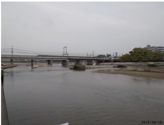
転倒している潮止め堰

3月中旬から5月下旬の約2か月半、アユの遡上時期に堰が転倒したことから、これまでにない河口域からの遡上アユが確認された。目視による遡上観察では、19日に1号床止工を盛んに飛び跳ねるアユが確認された。地元でのヒアリングによると、これほどたくさんのアユが飛び跳ねる姿