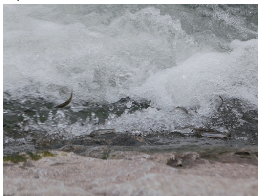
1号堰を飛び跳ねるアユ

当会では、アユの遡上にむけた武庫川の河川環境を見守り、県が主催する「アユが遡上できる武庫川づくり」に参画し、アユをはじめ魚類の挙動・遡上観察を行いながら、遡上を妨げる要因について調査を積み重ねてきた。2015年度は回遊魚であるアユが海から遡上する際の妨げになっていた潮止め堰が遡上時期に転倒していたことから、これまでにない観察結果を得ることができた。