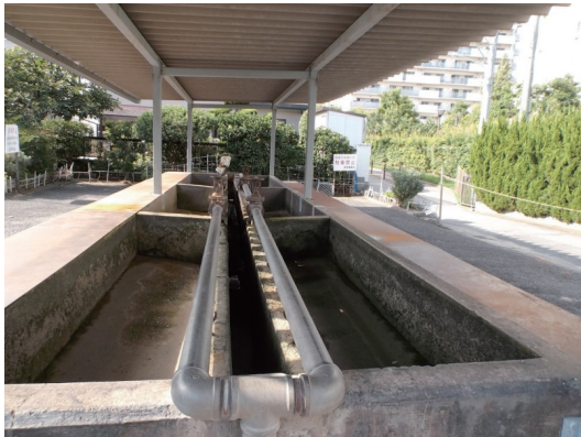
野菜洗い場(地下水を汲み上げる)