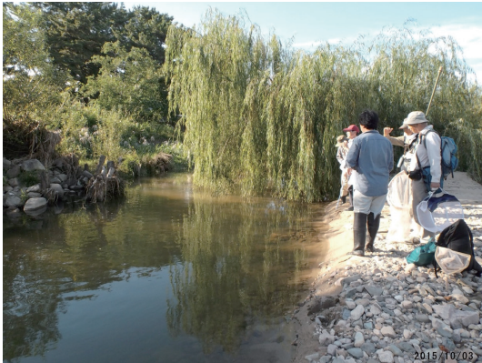
大雨の出水により度々攪乱され、新たな自然環境を生み出す仁川合流域

2015年度の潮止め堰転倒により、春のアユ遡上時期に潮止め堰を転倒すれば、7000個体強(兵庫県宝塚土木による調査)のアユが遡上することが判明した。また、転倒による遡上から仁川合流域にここ数十年来、最も多くのアユが群れを成し、仁川合流付近にはアユが快適に生息することのできる因子があることも確認できた。