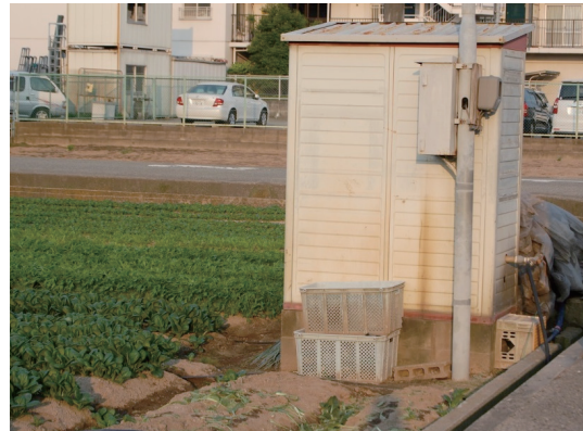
畑の井戸ポンプ小屋