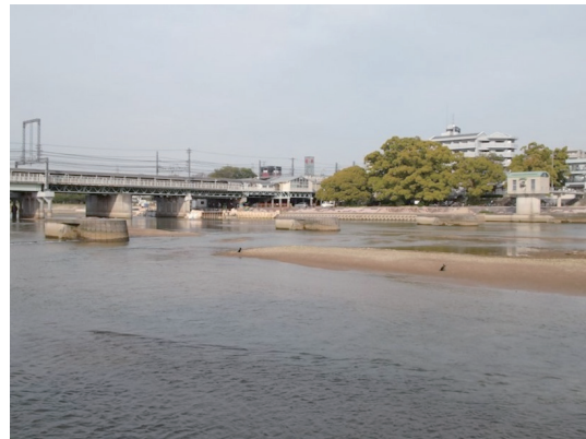
工事転倒中の潮止め堰