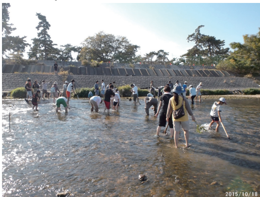
10月中旬アユの産卵床づくり 2号床止工下流で川底を掻いて一面を覆うカワシオグサを除く

2015年10月に下流武庫川においてアユの産卵床づくりと水辺の小枝づくりによる2号床止工の魚道改良が行われたが、温暖化の影響か、水温が下がらずアユの群れは11月末まで仁川合流付近に居座っていた。