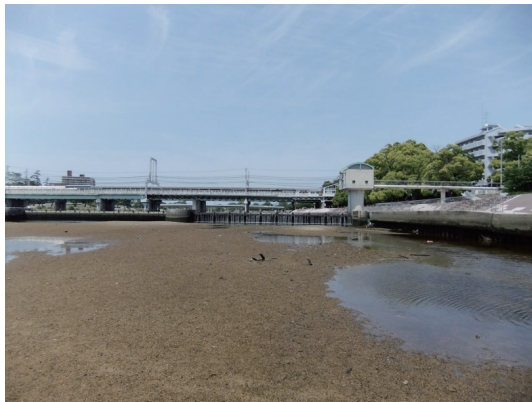
平常時の潮止め堰(大潮干潮時)

一方、平成 24 年から施行されている兵庫県武庫川水系河川整備計画における下流の河川整備事業では、武庫川本川の流下能力を上げるために、東海道線橋梁下流の 2 号床止までの下流区間で河道掘削を行ない、それに伴い潮止め堰を撤去する計画になっている。潮止め堰を撤去すれば、汽水域が上流に広がり、干潮域が 2 号床止にまでおよび、シンボルフィッシュであるアユをはじめとする魚類の遡上や干潟の創出などによって多様な水生生物の育む自然豊かな下流域が形成されることになる。しかし、撤去による地下水への塩水遡上、浸透による影響が懸念され、兵庫県では大雨による出水時に自然転倒する潮止め堰を試験的にも転倒させ、井戸水への塩水浸透調査を行っている。