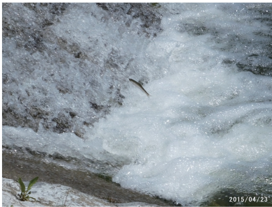
堰転倒で大きくなった1号床止の落差を飛び跳ねるアユ