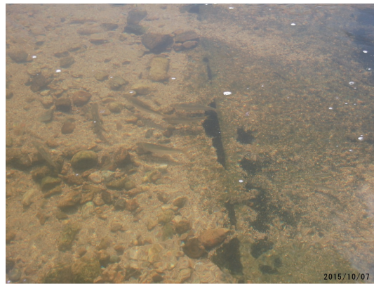
仁川合流付近 群れでアユが確認されたのは初めて