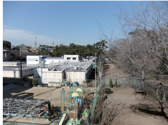
地下水を汲み上げる鳴尾浄水場

以上のことから潮止め堰の撤去が地下水に及ぼす影響より、撤去によって下流武庫川に提供される自然環境へのプラスの影響効果の方が大きいことが判明した。