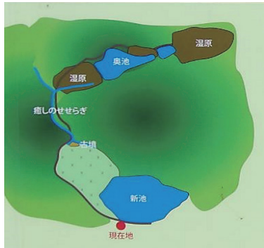
あびき湿原案内図 (第1湿原～第3湿原・奥池)