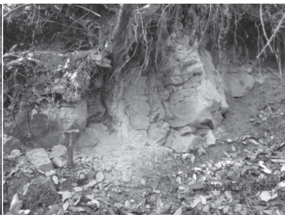
丹生山の山麓に分布する神戸層群の凝灰岩層