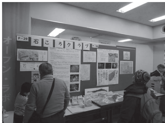
ポスター展示を見る参加者たち