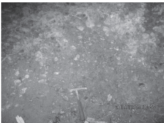
丹生山の山麓に分布する神戸層群の砂礫層

展示した岩石標本は、見かけはただの石ころにすぎません。しかしそれらは、私たちにとっては永遠の時の流れとも言える1億年から3千万年の時を経て、今ここにあるのです。こう考えると、なにかロマンを感じませんか！私たち「石ころクラブ」とともに、石ころのロマンを探しに行きましょう。