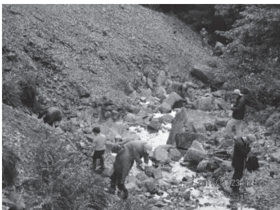
帝釈鉱山跡での岩石・鉱物の採集のようす