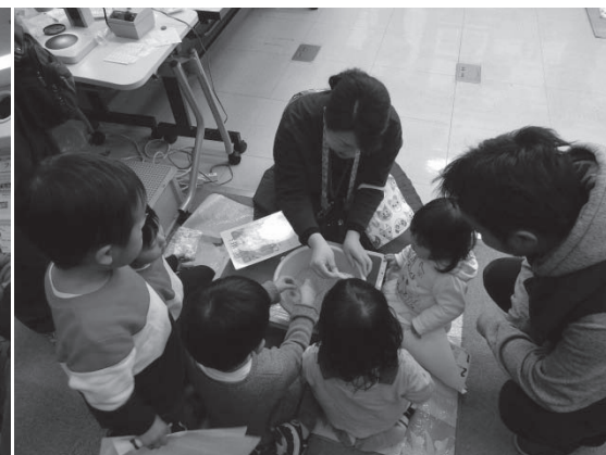
磁石で砂鉄をとる子ども向け体験コーナー