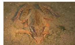
ニホンアカガエル

調査期間は、ニホンアマガエルとトノサマガエルは2019年5~6月、モリアオガエルは2017~2019年6~7月、ニホンアカガエルは2017~2019年2~3月に調査を実施した。