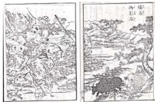
写真3 日本山海名産図会(国文学資料館『古典籍データセット(第0.1版)』)