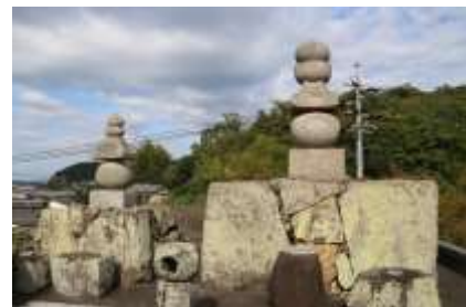
写真2 六甲山地の花崗岩製五輪塔（島根県益田市）