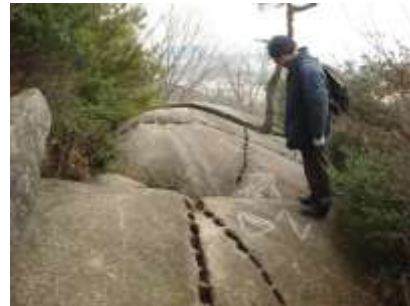
写真1 六甲山地に残る石割の痕跡

これまでの研究で六甲山地の花崗岩は鎌倉時代から各地に流通していたことがわかってきた。また、江戸時代から明治時代にかけて就航した北前船では、瀬戸内の花崗岩類が大量に日本海沿岸地域に運ばれた。このうち六甲山地の花崗岩とそれ以外の花崗岩について、山陰から北陸地域にどの程度運ばれたかを示したのが図1である。これによると、鎌倉時代から安土桃山時代にはもっぱら六甲山の花崗岩のみが流通していた。江戸時代に入ると徳川大坂城築城をきっかけに瀬戸内各地の石材が加わり始める。それらは北前船が盛んになるにつれて増加していくが、六甲山地の花崗岩はそれほど増加せず、石材の主体が他地域のものに変わっていったことを示している。それではなぜ、江戸時代