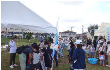
図 4. アサザ祭りの様子

特に、ため池は夏季に多様な水草が生育する場でもあるため、アサザ祭りやオニバス観察会など、水草を中心としたイベントも継続的に実施している。イベントでは、ため池管理者と行政、専門家が協力して取り組んできた。