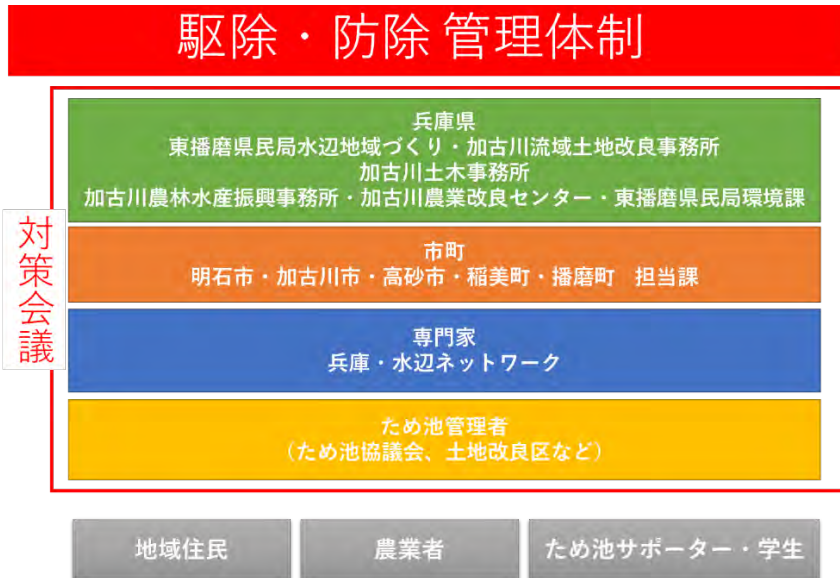
図 8. 駆除・防除管理体制