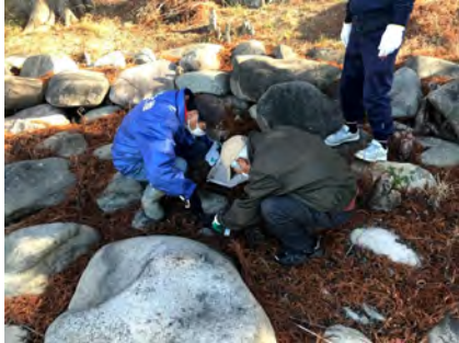
図 6. 手作業で芽と根を駆除する様子

効果的な駆除活動を実施するには、関係各所の連携が必要である。いなみ野ため池ミュージアムの活動を通して、主な関係者同士の交流があったことで、当初からスムーズな連携が取れたことが駆除体制の確立に有効だったと考える。駆除費用についても、行政のため池保全のための補助金を活用することで、早期に駆除作業を開始することができた。また、定期的開催される対策会議においては、専門家やため池管理者、行政関係者などによる活発な議論が毎回交わされ、常に効果的な駆除方法の検討ができる体制になっている。