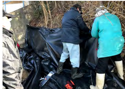
図 7. 遮光シートを設置する様子