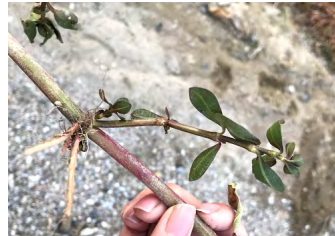
図 2. 節から根と芽が出る