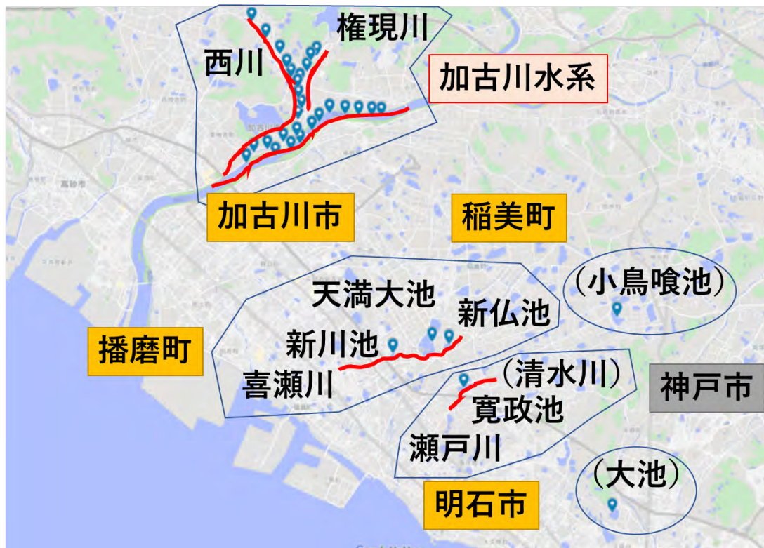
図 9. 東播磨地域と近隣でナガエツルノゲイトウが確認された地点 (2021年2月11日時点)