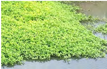
図 1. 水辺に広がる様子

ナガエツルノゲイトウは、南アメリカ原産の外来植物で、節から根や芽が出て、増殖する。水面をマット状に横に広がる茎は、長さ1mを超えることもある。ストローのように茎が中空で、水に浮いて拡散する。水田に侵入すると農業被害を引き起こす恐れがあり、河川やため池から水田や水路に入れぬ対策と根絶を目指した活動を行っている。