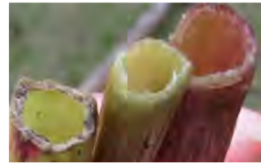
図 3. 茎は中空