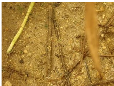
容器A サギソウを植えたもの 左の白いのは根か地下茎