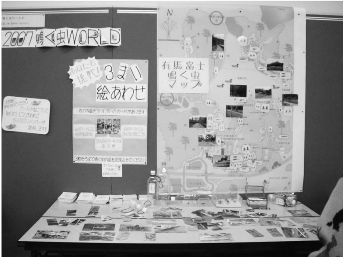
図3 ポスター展示の現場風景

以上のような展示物を図3のように展示した。この展示と口頭発表を合わせて、今回は「名誉館長賞」を頂いた。「きんひばり」が一丸となって作り上げた結果である。来年度の「きんひばり」は新しい場所のマップづくりを計画している。新しい虫、新しい鳴き声との出会いがきっとあるはずである。