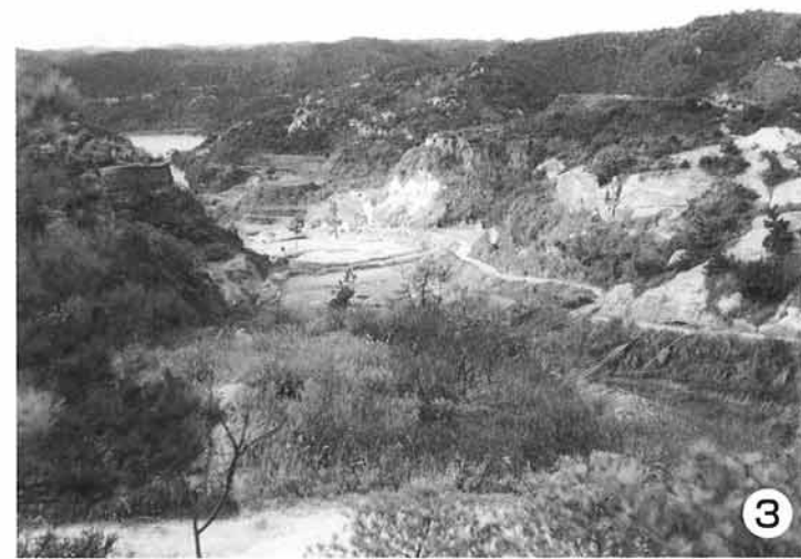
3. 1973年の花の谷から落合池方面の神戸層群露出状況