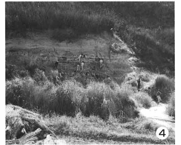
4. 花の谷で植物化石採集をする小学生たち

休日を費やし新たな種、新たな産地を求めて精力的に活動を行い、夜はクリーニングや植物の勉強に熱中しました。その成果を1976年に『神戸層群産植物化石』として出版し、179種を記したのです。