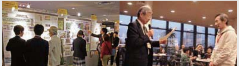
みんなで意見交換