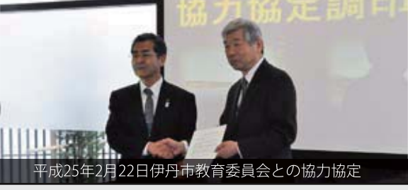
平成25年2月22日伊丹市教育委員会との協力協定