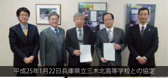
平成25年1月22日兵庫県立三木北高等学校との協定