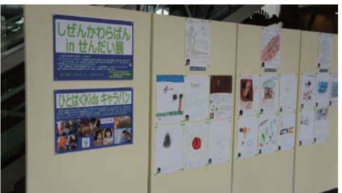
地元での展示の様子(仙台市科学館「六郷・七郷しぜんかわらばん」2012年10月)