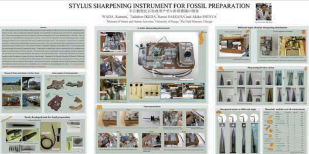
米国古脊椎動物学会で発表されたポスター