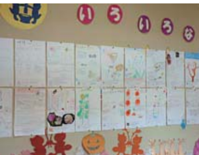
地元での展示の様子(古道小学校「古道・岩井沢しぜんかわらばん」2012年9月～10月)