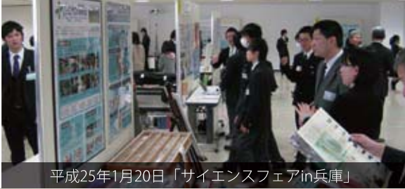
平成25年1月20日「サイエンスフェアin兵庫」