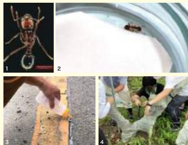
1.国内に侵入したヒアリ標本写真 2.わさびシートによるヒアリの忌避実験 3.シリコン樹脂によるコンテナヤードの亀裂補 4.クビアカツヤカミキリの防除技術講習会

2017年、博物館に環境省から神戸港に陸揚げされた中国のコンテナに潜んでいたアリが同定のために送られてきました。そのアリこそ、特定外来生物のヒアリでした。中国からのヒアリ侵入は現在も続いており、その侵入は90事例にのぼっています。さらに、コンテナヤードの舗装面にできた亀裂で、ヒアリの大きな巣が見つかる事例も30件近く確認され、巣からは翅のある新女王アリも多数見つかっています。このままコンテナ貨物によるヒアリの侵入とヤードでの営巣が続けば、自力で5kmほど、風に乗れば30kmは飛翔する新女王アリによって、港湾の背後地である都市部にヒアリの定着が起こるのは時間の問題です。ひとはくでは、環境省から環境推進費の助成をいただき、わさびの匂いをマイクロカプセル化したシートを忌避剤にしてコンテナ貨物へのヒアリ侵入を防ぐ研究や、シリコン樹脂でコンテナヤードの亀裂を補填してヒアリ営巣を阻止する研究に取り組んでいます。わさびシートは、博物館の標本管理で人や環境に安全な防虫防カビ剤として活用を進めていたもので、シリコン樹脂はプ