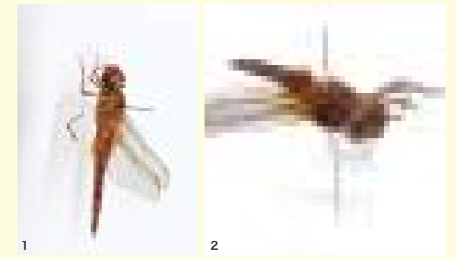
1.遺伝情報を長期する昆虫乾燥標本。0.2mlチューブ内に99%プロピレングリコールと筋肉組織(この場合は脚)が入っており、チューブの蝶番の部分に昆虫針を刺すことで遺伝解析用サンプルと一緒に保存できる。上から見た様子 2.横から見た様子

そこで、ひとはくでは遺伝情報を長期保存できる昆虫乾燥標本の作製方法を開発しました。方法はとても単純です。①標本作製時に、99%プロピレングリコールの入った0.2mLチューブに一部の筋肉組織(脚など)を入れる、②昆虫本体が刺さった昆虫針を、体組織の入ったチューブの蝶番に刺す(図)、たったこれだけです。作製にかかる費用も1つの標本あたり10円程度で済み、特別な薬品や設備が