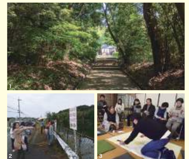
1.和歌山市の伊達神社の参道 2.地域の魅力と課題を歩きながら発見するツアーのようす 3.ツアーの成果をみんなで話し合いプロジェクトへと展開

一方で、多くの神社では、持続可能な管理のしくみが課題となっています。氏子制度が崩壊しつつあり、総代・神職の高齢化も進んでいます。そのような課題に対して、和歌山市の伊達(いたて)神社という式内社において、宮司、氏子総代、地域住民、専門家が共に、コミュニティ活動の重要な拠点として神社を位置付けていく社会実験を展開しました。この実験では、神社の関係者と近隣住民が主体となり、