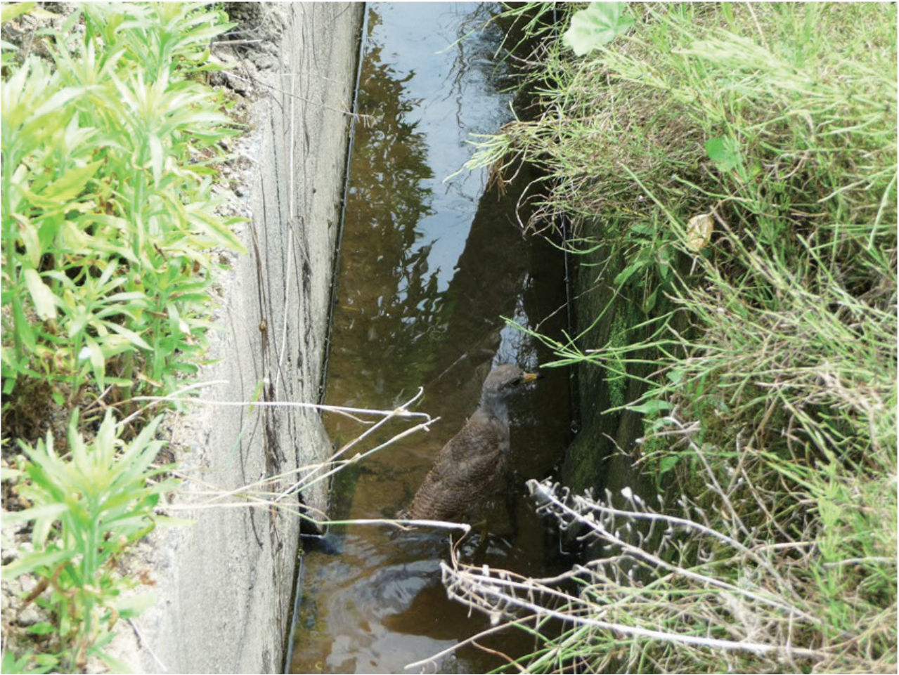
図2 水路の中で発見されたケリのヒナ（2009年5月23日）。

はヒナの日齢の進行に伴って長くなり、30日齢のヒナの移動距離は巣場所を起点に半径40mの範囲内にあることが知られている（脇坂・江崎，2015）。このことは、ヒナは孵化直後から水路に近づく機会があり、成長に伴って水路に落下するリスクが高まることを示している。今回発見したヒナの日齢を、ケリを人工的に飼育した河地（2020）の報告に基づいて推定すると約28日齢であり、おそらく巣場所から40mの範囲内の水路に落下したと推察された。また、ヒナが飛翔できるまでには孵化後約40日から63日かかることから（伏原，1959；河地，2020）、水路で発見されたヒナが飛翔可能になるには、約12日から35日を要することになる。このため、人為的に救出しなかった場合、ヒナは約12日から35日程度、水路内に滞在しなければならなかった。近年、巨椋池干拓地内の水路では、肉食性の外来生物であるアライグマ Procyon lotor およびチョウセンイタチ Mustela sibirica の足跡の目撃事例が増加傾向にあること（脇坂，未発表）、加えて、水路内におけるケリの餌資源が田面に比べて少ないことを考慮すると、水路に落下したヒナが順調に成長して飛翔能力を発達させ、