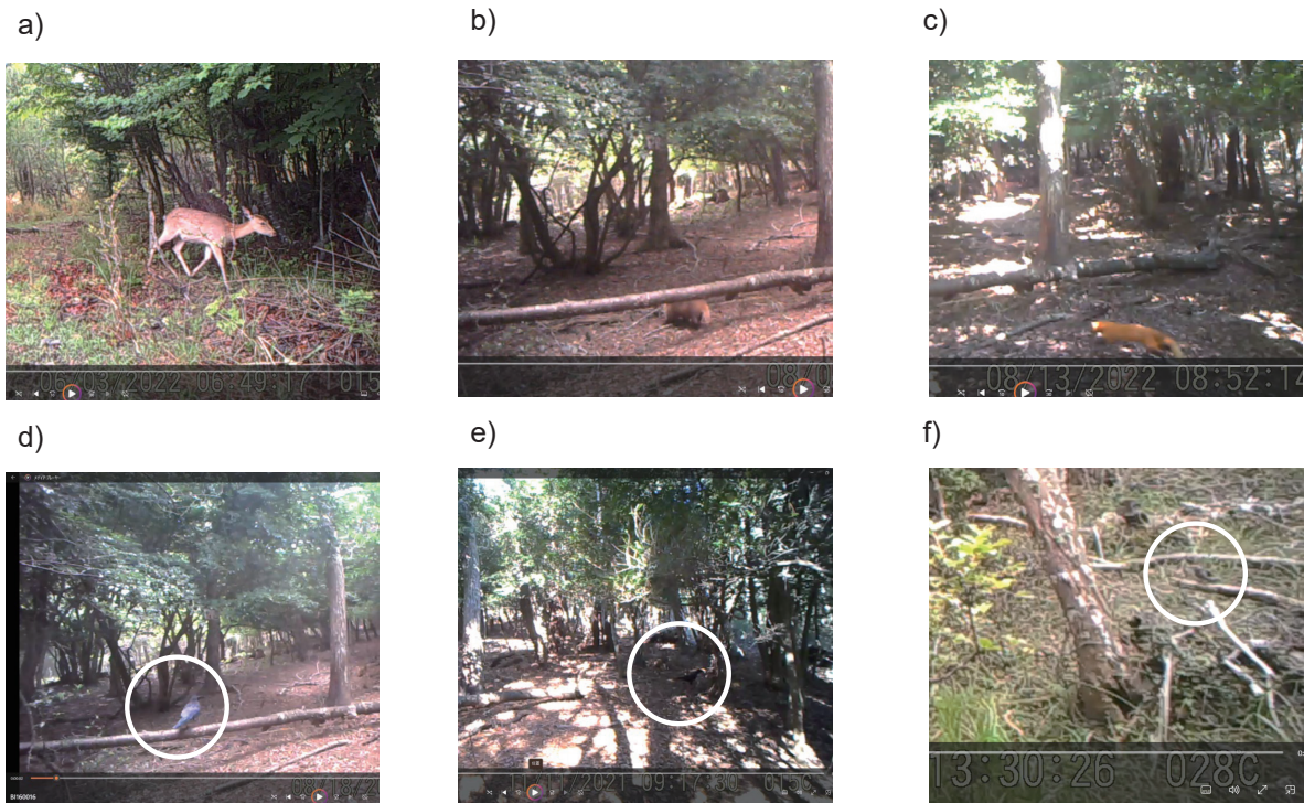
図2 清崎で撮影された動物. a) ニホンジカ, b) ニホンアナグマ, c) ニホンテン, d) ハシボソガラス, e) ハシブトガラス, f) ヒヨドリ.