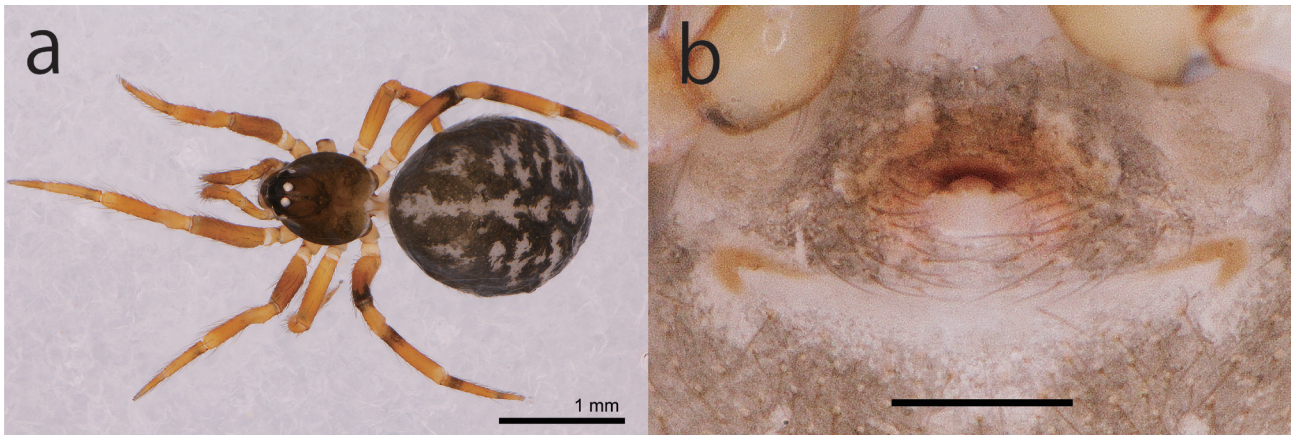
図4 ヨシダミジンゴモ Lasaeola yoshidai (Ono, 1991), メス, (a)背面, (b)外雌器. スケール:(a) 1 mm; (b) 0.2 mm.