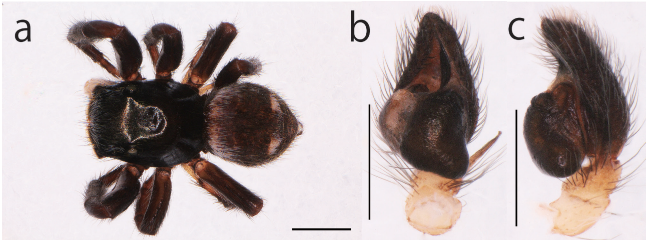
図1 ヤガタハエトリ Pseudeuophrys erratica (Walckenaer, 1826), オス, (a)背面, (b)触肢, 腹面, (c)触肢, 後側面. スケール:(a) 1 mm; (b)-(c) 0.5 mm.