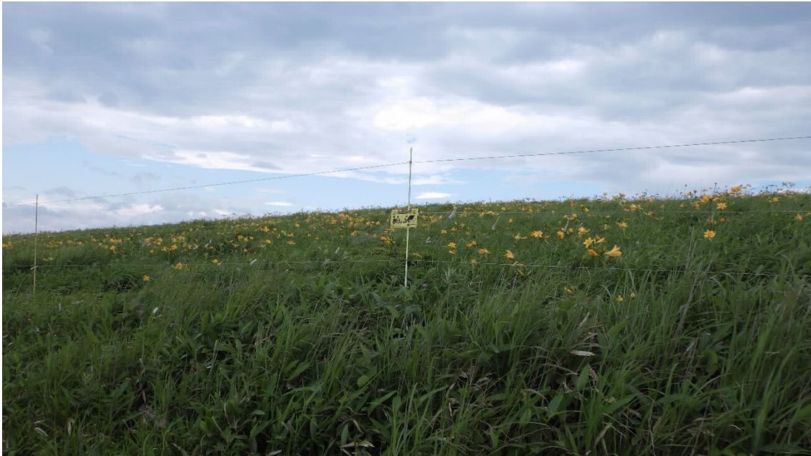
図1 霧ヶ峰に設置されている防鹿柵。柵内（奥）はシカが侵入できず、多くの花が見られる。一方、柵外（手前）にはほとんど花が見られない。