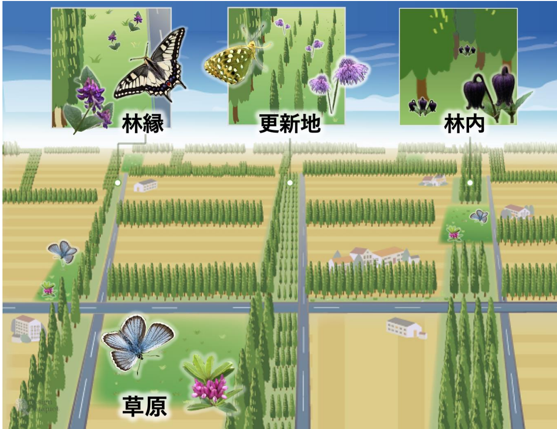
図1 研究成果の概要